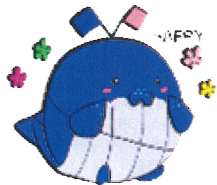
▲ ほえっぴーのスタンプ

また、皆様からの公募により誕生した長門市社協PRキャラクター『ほえっぴー』は、市内の各種イベントや研修会、広報紙面等、様々な機会でも活躍していますが、更に多様な各種キャラクターグッズを開発して、福祉に対する親しみやすさとイメージアップを図ります。現在、『ほえっぴー』のイラストは多くの方が利用しているLINEスタンプにも採用されるなど『ほえっぴー』を通じて長門市のPRにも一役買いたいと考えておりますので、引き続き応援をよろしくお願いします。