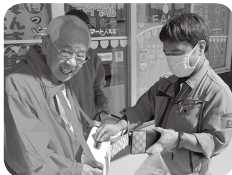
▲ サンマート人丸店