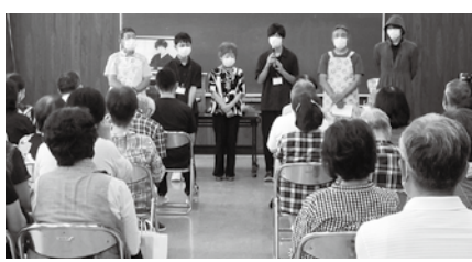
▲福祉員研修会にて、寸劇に挑戦！