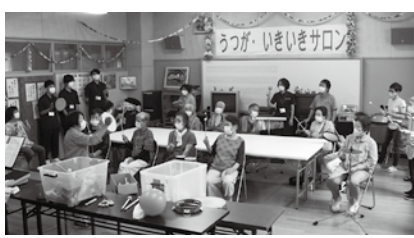
▲ボランティア活動・サロン訪問

社会福祉士国家資格取得を目指す山口県立大学社会福祉学部3年生5名(市社協3名、湯の家2名)を8月16日から9月15日まで、実習生として受け入れました。 地域の皆様のご協力により、無事に終わることができました。ありがとうございました。