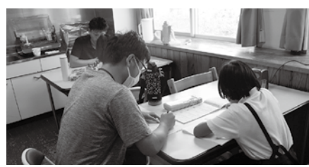
▲入所児と一緒に勉強中・・・